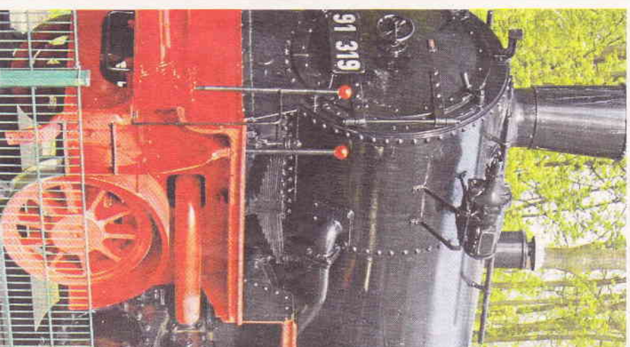
Die alte Lok ist magischer Anziehungspunkt am