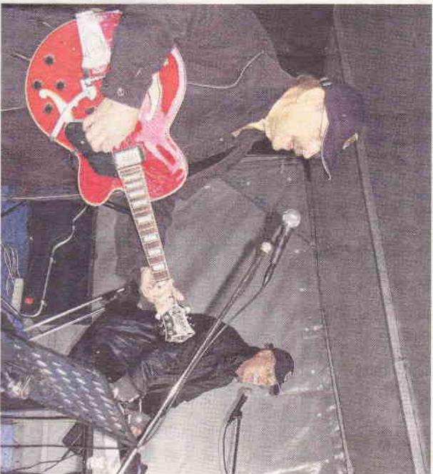
Das Duo „Tö Gether“ unterhält beim Maibaumspektakel musikalisch.

KG Pängelanton lädt zum Maifest nach Gremmendorf