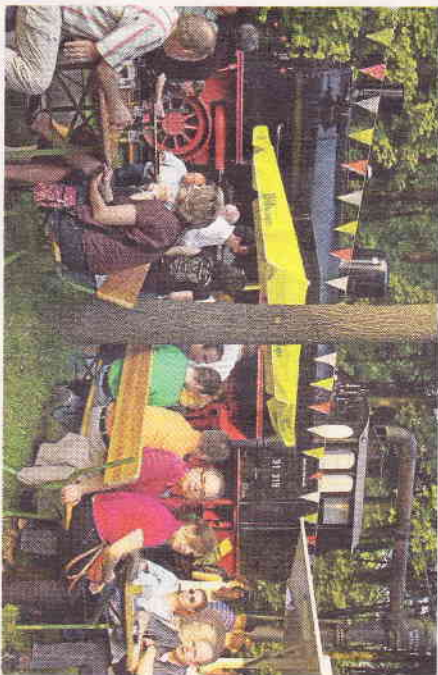
An der Lok wird traditionell der 1. Mai gefeiert.

PAUL-MÖLLERS & SOHN Heizung, Lüftung, Sanitär Wartungs- und Notdienste