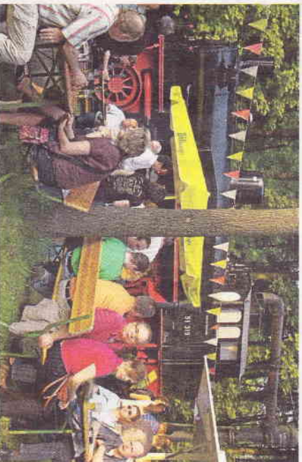
An der Lok wird traditionell der 1. Mai gefeiert.

PAUL MÖLLERS & SOHN Heizung, Lüftung, Sanitär Wartungs- und Notdienste